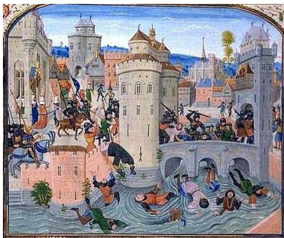
Os jacques são massacrados em Meaux., 1358

Aproximadamente entre 1347 e 1353, a “Peste Negra” – nome pelo qual ficou conhecida a peste bubônica, septicêmica ou pneumônica no século XIV – se alastrou pela Europa, chegando a alcançar a Ásia, causando a morte de 75 a 200 milhões de pessoas. No caso da França, que também se envolveu na Guerra dos Cem Anos (1337-1453) contra a Inglaterra, a escalada mortal foi ainda maior, trazendo fome, morte e miséria principalmente entre as camadas mais pobres da população. Oprimidos pela alta dos impostos, pelo confisco dos seus bens e pelo aumento da exploração sob o seu trabalho, os camponeses iniciaram uma revolta sangrenta. Menos de três décadas depois, em 1381, uma revolta camponesa de grandes proporções também varreu a Inglaterra, chegando a alcançar Londres. Em ambos os casos, a repressão da nobreza contra os revoltosos foi violenta e os seus principais líderes foram perseguidos em executados. O temor causado pelas Revoltas Camponesas, fez com que os nobres se articulassem e começassem a desenhar o Estado Absolutista, que dominou o cenário político europeu entre os séculos XVI e XVIII.