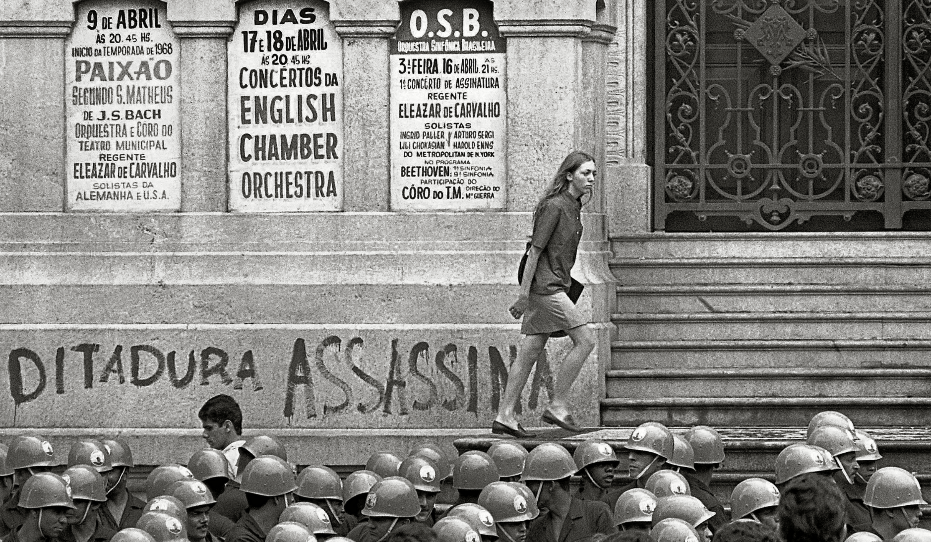
(ESTUDANTE NA ESCADARIA DO THEATRO MUNICIPAL, RIO DE JANEIRO, RJ, 1968).