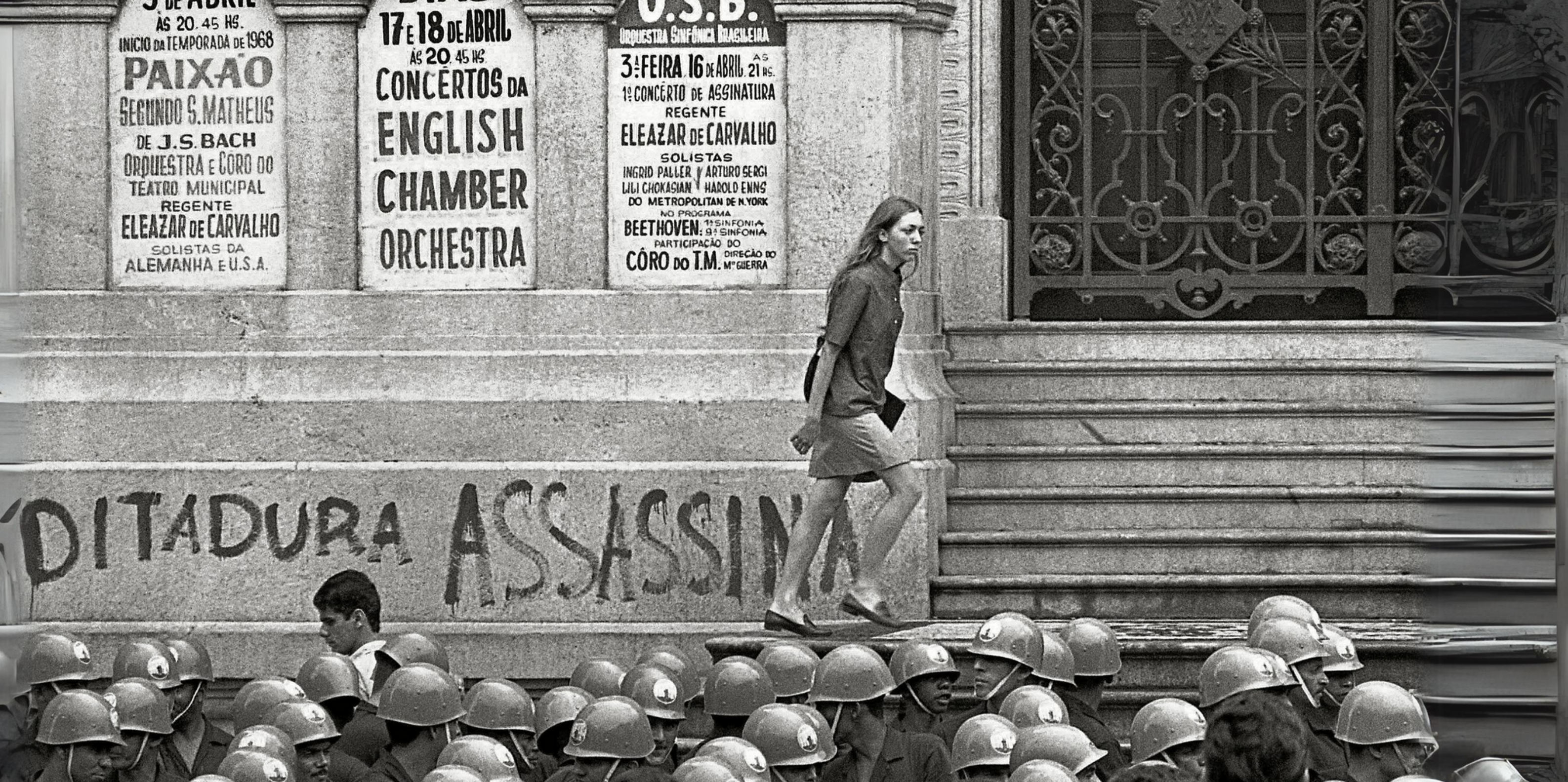
(ESTUDANTE NA ESCADARIA DO THEATRO MUNICIPAL, RIO DE JANEIRO, RJ, 1968).